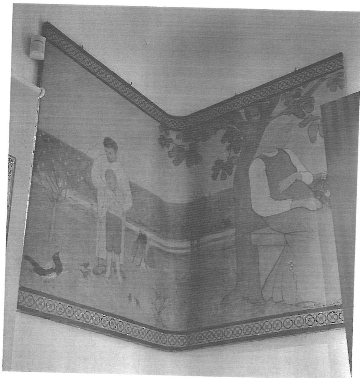
Widoczny brak listewek maskujących krawędzie.